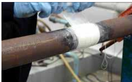
4. Aplikujte vytvrdzovacia fóliu