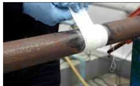
3. Aplikujte bandáž