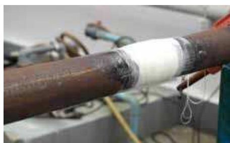
5. Aplikácia je ukončená