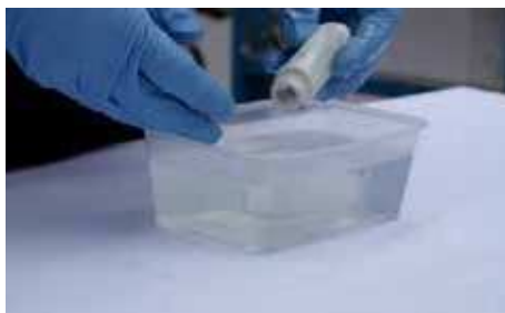
2. Namočte bandáž