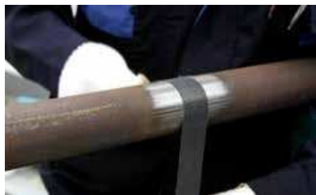
1. Zdrsните a očistite povrch